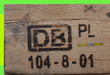
Paleta EUR EPAL

Przykładowe oznaczenia wspornika środkowego: