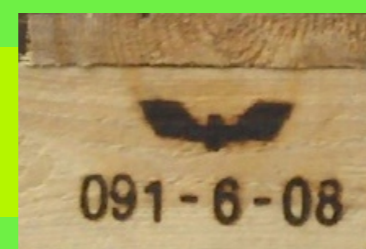
Paleta EUR CD (Czechy)